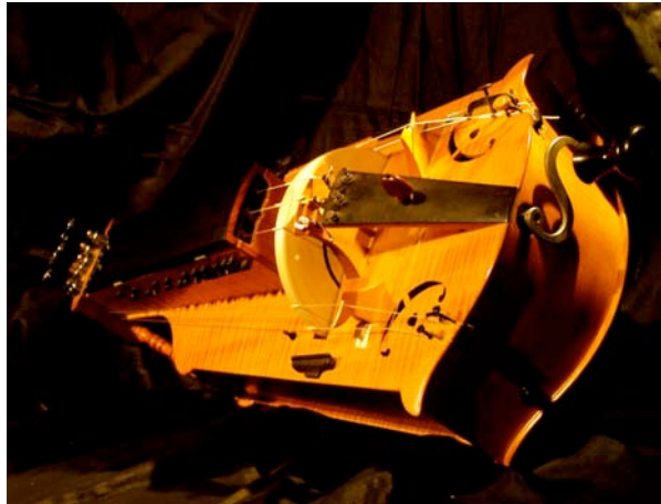
La vielle à roue