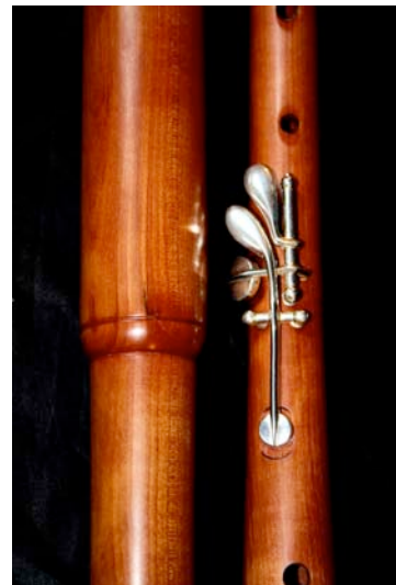
La cornemuse au gros bourdon